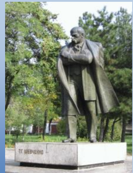
Пам'ятник Тарасу Шевченку. м. Миколаїв. Сквер ім. Тараса Шевченка

До 200-річчя від народження Тараса Шевченка